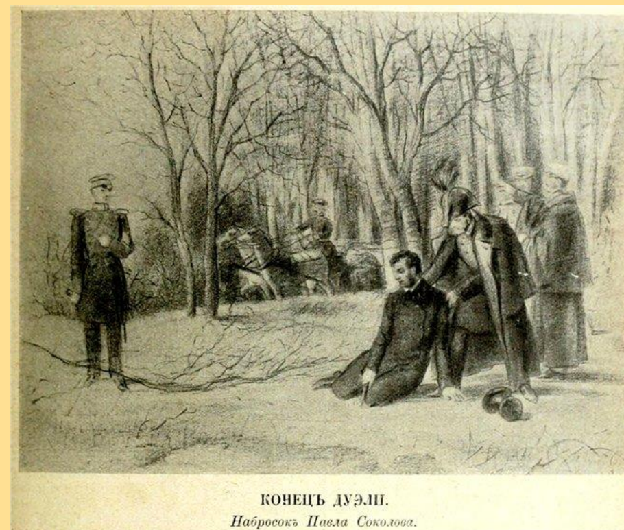
КОНЕЦ ДУЭЛИ. Набросок Павла Соколова.